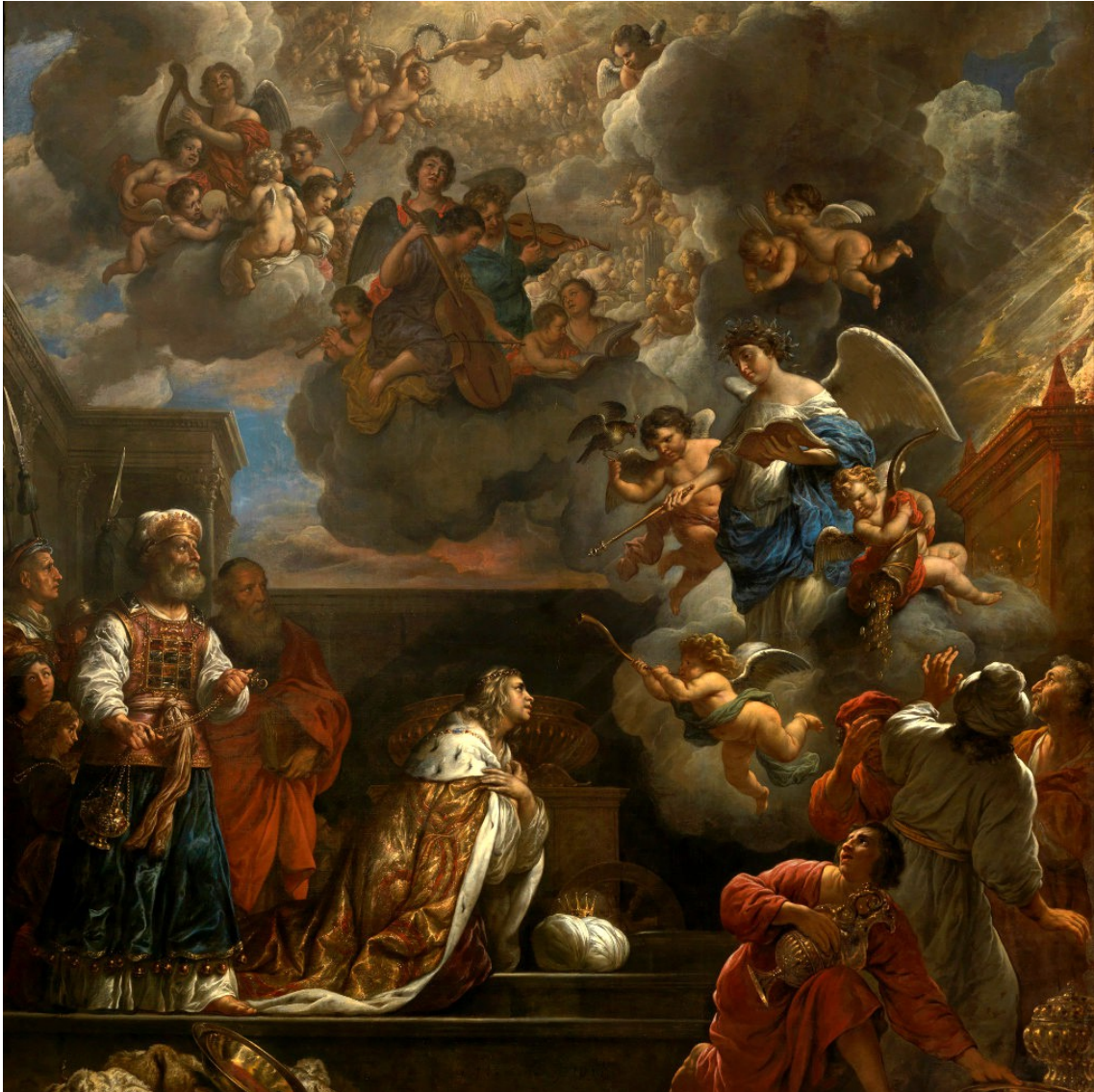
Salomo vraagt om wijsheid, Govert Flinck, 1658 Koninklijk Paleis, Amsterdam

Nieuwsbrief Johanneskerk (externe versie) 24 januari 2025